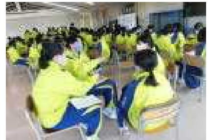
※しおりの読み合わせと、マシュマロチャレンジの作戦会議の様子です