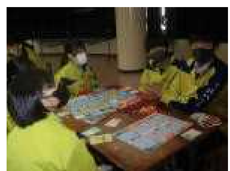
※SDGsの説明を聞く生徒