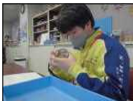
※七ヶ浜歴史資料館

11月17日、18日の2日間にわたり職場体験学習が行われました。当日は天気も良く生徒たちにとってとても有意義な時間となっようです。月曜日の解団式で感想を聞くと、多くの生徒から「楽しかった。」という声があがりました。また、体験の時の様子を話し始めると止まらなくなる生徒もたくさんいました。きっと学校では体験できない多くの学びがあったのだと思います。