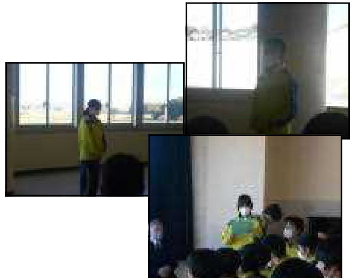
※ 職場体験学習結団式の様子