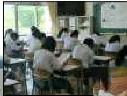
※実力テストを受けている様子